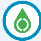
Bio-brosesu a Bio-buro