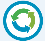
Canolbwyt y Campws