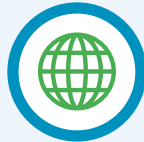
Bwydydd y Dyfodol